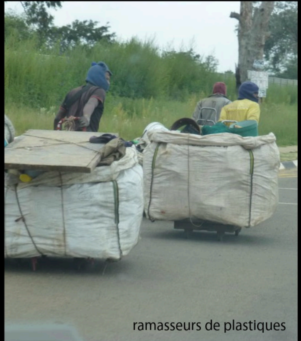
ramasseurs de plastiques

Noir, j'ai compris que ma vie appartenait à mon maître blanc, je devais donc me libérer