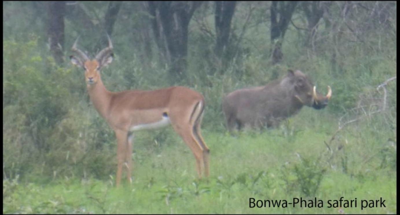
Bonwa-Phala safari park