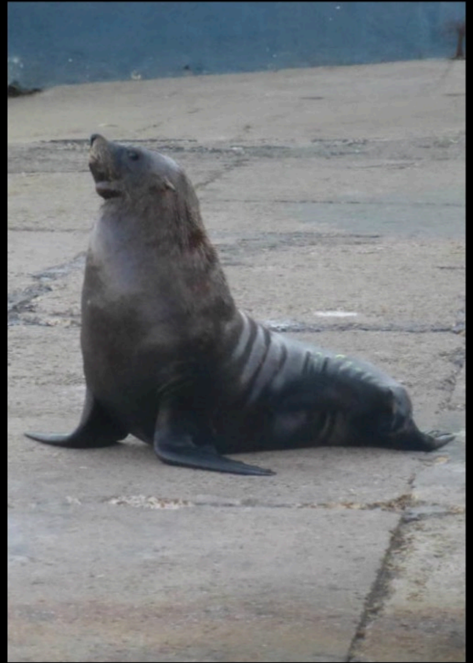
baleines, dauphins, phoques, pingoins