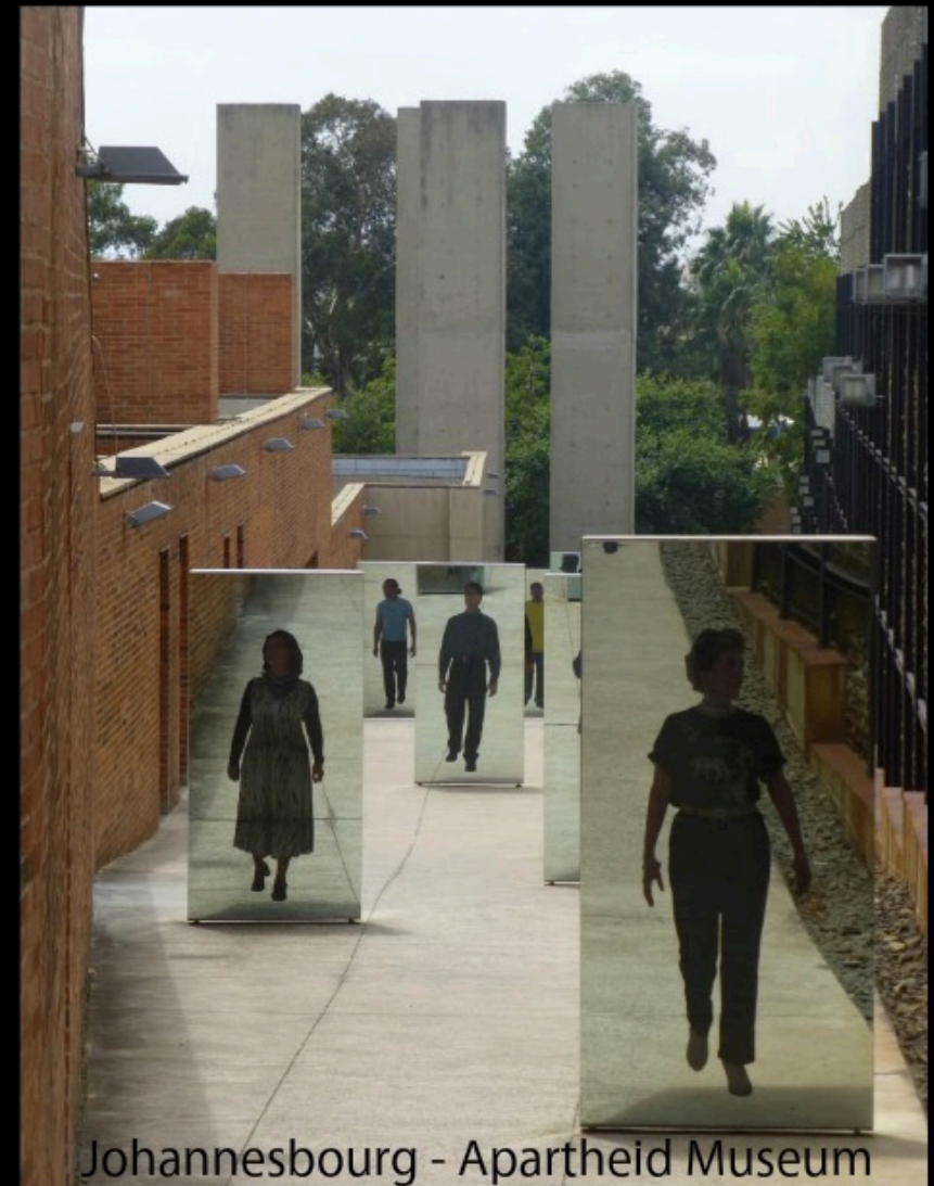
Johannesbourg - Apartheid Museum

Tous les Sud-Africains sont désormais déclarés comme: blancs, métis ou indigènes