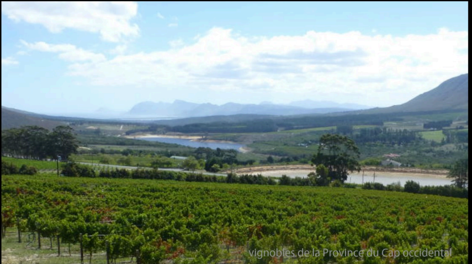
vignobles de la Province du Cap occidental

nulle part ailleurs, la terre n'est tendue de tant d'émotion que dans la paume ouverte de ce pays