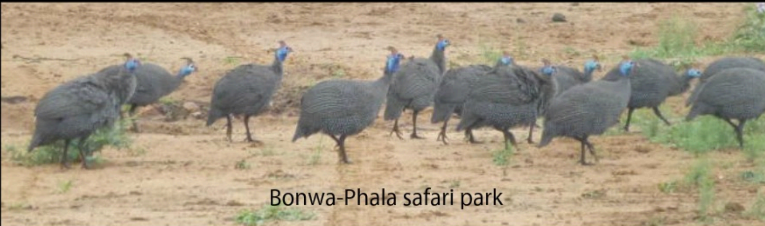
Bonwa-Phala safari park